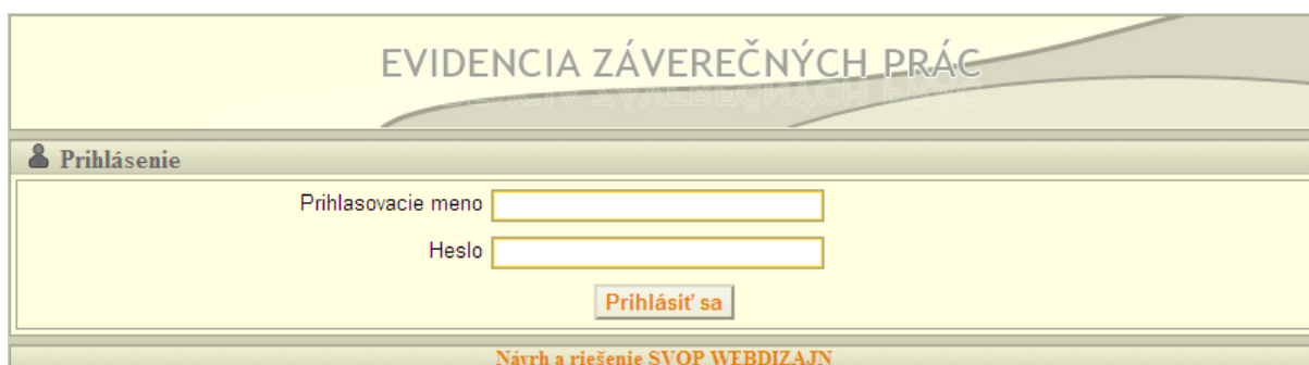
Obr. 1.: Prihlasovanie do systému

Aplikácia „Evidencia záverečných prác“ slúži na odovzdávanie záverečných prác rôznych typov pomocou web rozhrania. Prihlasovanie je možné prepojiť s LDAP alebo je možné využiť prihlasovanie pomocou autorít z databázy pomocou dohodnutých identifikátorov. Rozlišujeme nasledujúcich používateľov (role): študent, doktorand, školiteľ a administrátor (univerzity - fakulty - katedry). Rola prihláseného používateľa sa zobrazuje vedľa jeho mena.